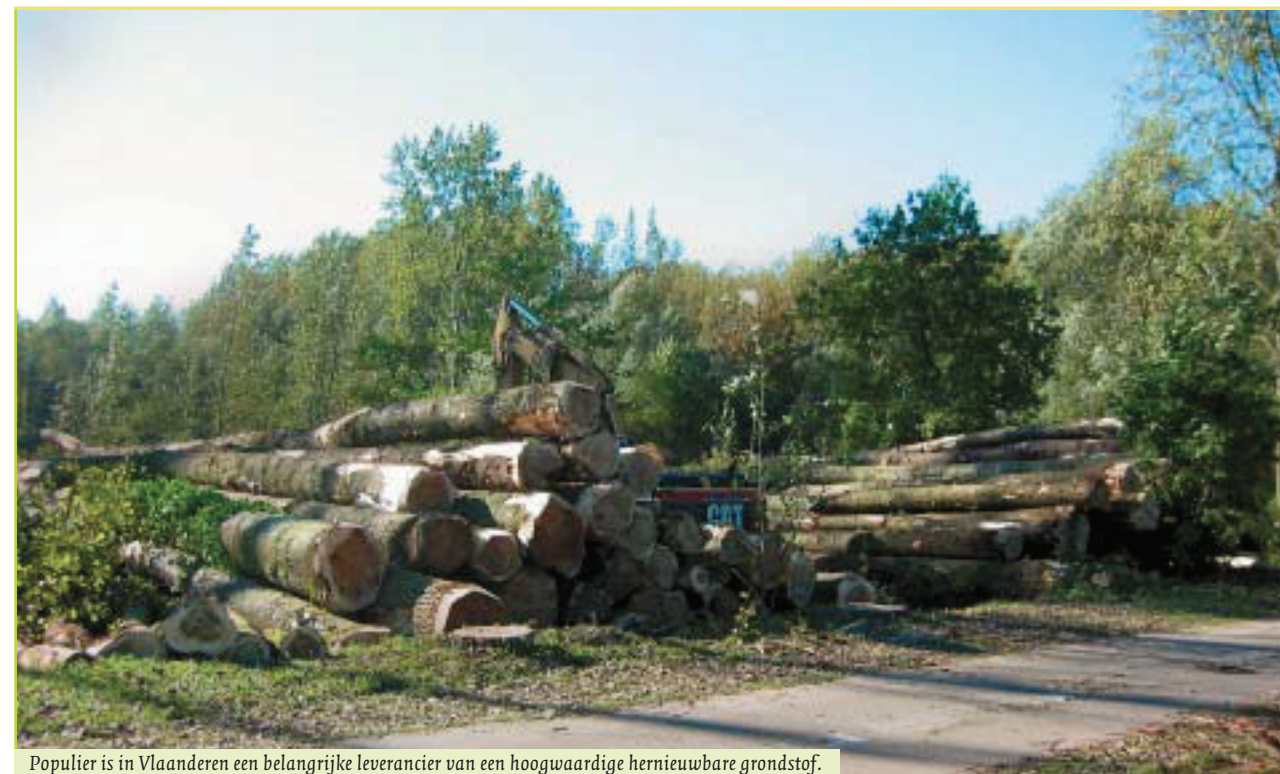
Populier is in Vlaanderen een belangrijke leverancier van een hoogwaardige hernieuwbare grondstof.